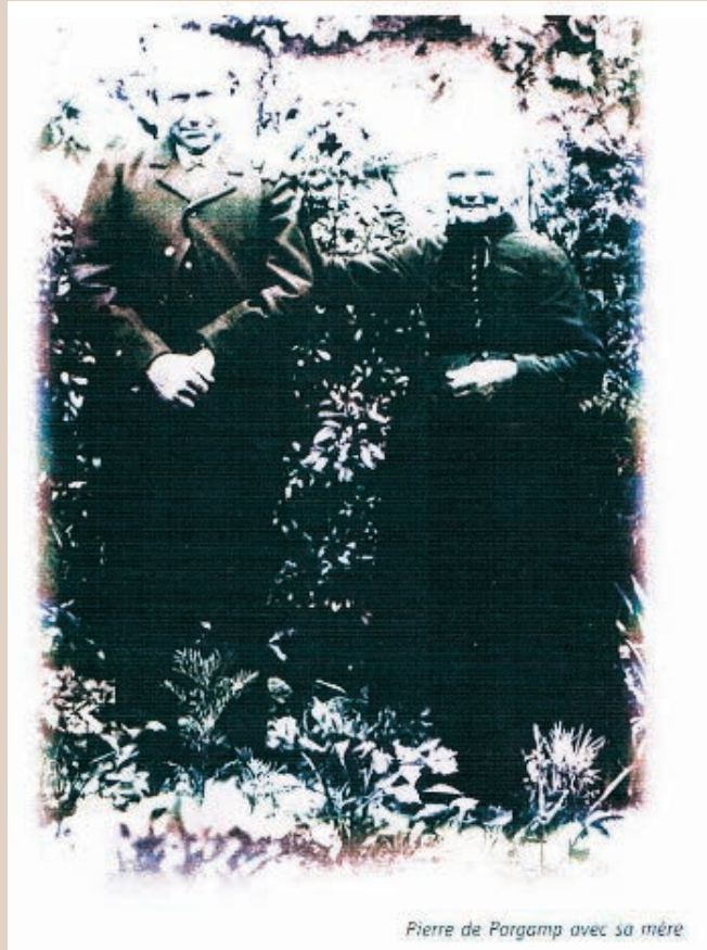
Pierre de Porgamp avec sa mère

Émile Pierre Marie Durand voit le jour le 10 septembre 1879 dans le village de L'Orme. Il est scolarisé à l'école communale où il développe une sensibilité littéraire. De famille modeste, il s'instruit en autodidacte. Puis, fréquentant le milieu nantais, il publie son premier recueil de poésies en 1903 sous le pseudonyme de Pierre Porgamp. Cette même année, il fonde " Le Pays Gallo ", périodique traitant d'histoire, d'art, de l'amour de la Bretagne, de l'attachement à la foi catholique, à la monarchie garante des particularismes régionaux. Il signe également des articles littéraires dans des revues telles que " Le Terroir Breton " ou " Le Pays d'Arvor ". Il participe au Collège des Bardes, cénacle rennais, sous le nom de Mab An Douar (le fils de la Terre). Il se marie à Neuilly sur Seine le 29 octobre 1908 avec Catherine Jeanne Baltzinger. De cette union, naît Annie le 11 avril 1910 à Rennes. Pierre Porgamp est rédacteur en chef du " Journal de Rennes " jusqu'en 1914, date à laquelle il démissionne en raison de ses convictions royalistes. Participant à l'intégralité de la Grande Guerre, il en sort épuisé et malade et s'installe à Paris. Il continue d'écrire dans " Le Figaro ", " La Paroisse Bretonne ", " Le Pays Breton ". Le 20 février 1925, il succombe au mal contracté durant les combats. >>>